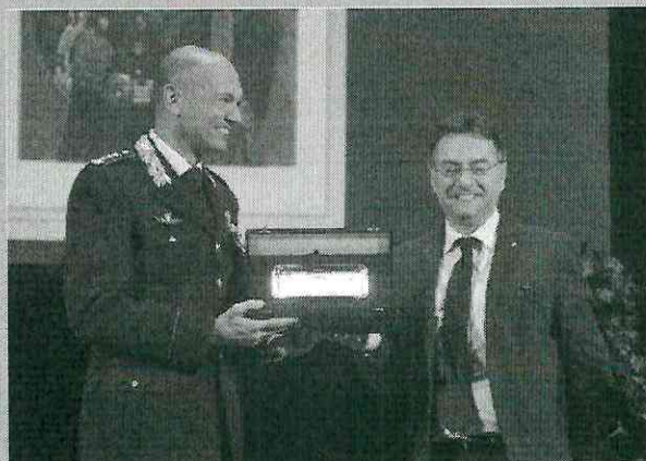
IN ALTO LA CONSEGNA DELLA TARGA AL DIRETTORE DEL NOTIZIARIO STORICO. SOTTO LA GIURIA DEL PREMIO

"L'Arma dei Carabinieri, dalla sua fondazione nel 1817, ha sempre avuto un occhio di riguardo per la preservazione e la diffusione della storia e delle tradizioni italiane. In questo solco secolare, nutrito di pubblicazioni e volumi a carattere sia monografico che periodico, con il "Notiziario Storico dell'Arma dei Carabinieri", ha deciso di rendere più stimolante, moderna e diversificata la propria offerta storiografica, mettendosi fuori dagli schemi retorici e tradizionali della memorialistica militare ovvero delle monografie celebrative, proponendo contenuti inediti spaziando dalle cronache operative del passato, alla riscoperta degli avvenimenti di portata più generale per l'Istituzione, sempre avendo presenti, sullo sfondo, gli accadimenti della Grande Storia".